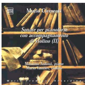
Muzio Clementi Sonate per pianoforte con accompagnamento di violino vol. II Cd Rivoalto 9835