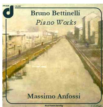
Bruno Bettinelli Piano Works Cd Ducale 040