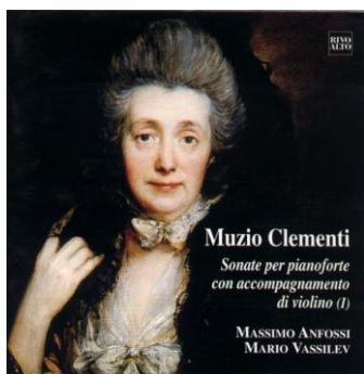
Muzio Clementi Sonate per pianoforte con accompagnamento di violino vol. I Cd Rivoalto 9812