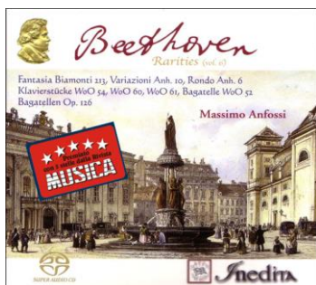
Ludwig van Beethoven Beethoven Rarities Vol 6 Cd Inedita cd PI 2362